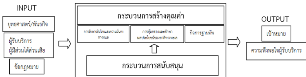
แผนภาพที่ ๓ แสดงการวิเคราะห์ห่วงโซ่คุณค่า ทพเรือภาคที่ ๒ SIPOC Model

ทำหน้าที่ป้องกันราชอาณาจักรและรักษาความมั่นคง รวมทั้งผลประโยชน์ของชาติทางทะเลในพื้นที่อ่าวไทยตอนล่างจากภัยคุกคามต่าง ๆ และดำเนินการเกี่ยวกับการฐานทัพ การป้องกันพื้นที่ การสารวัตรทหาร กิจกรรมพลเรือน และการควบคุมเรือพาณิชย์ตามที่ได้รับมอบหมาย เพื่อส่งมอบความมั่นคงปลอดภัยในชีวิตและทรัพย์สินให้แก่ประชาชน